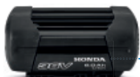
36V 6,0 Ah DP3660XA