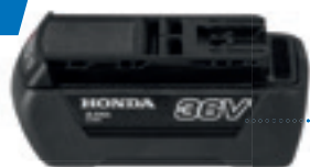
36V 2,0 Ah DP3620XA E