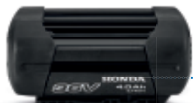
36V 4,0 Ah DP3640XA